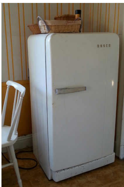
Ett kärt kylskåp, på Nämndö, av den gamla hållbara sorten. Ännu inte redo för återvinningen.