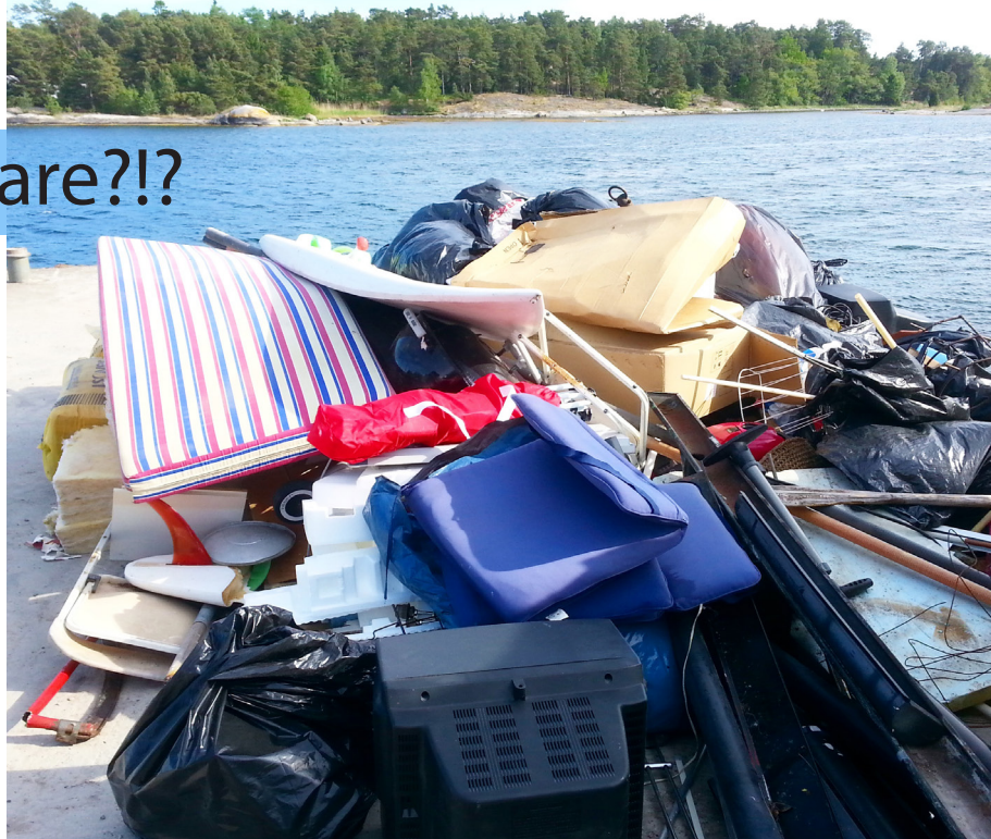
Växande grovsopeshög på ångbåtsbrygga, vanlig syn så här års.

Folk började troppa av när de var färdiga med sina sopor. Vi var en liten skara kvar på slutet som insåg att du inte skulle kom-